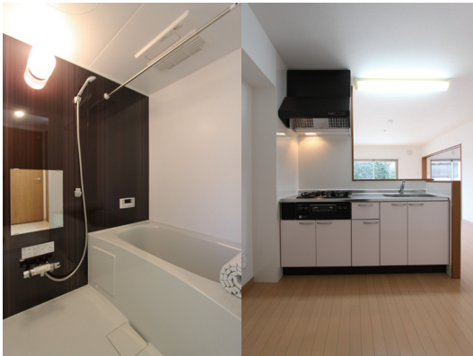
先行モデルルーム OPEN (イメージ写真)