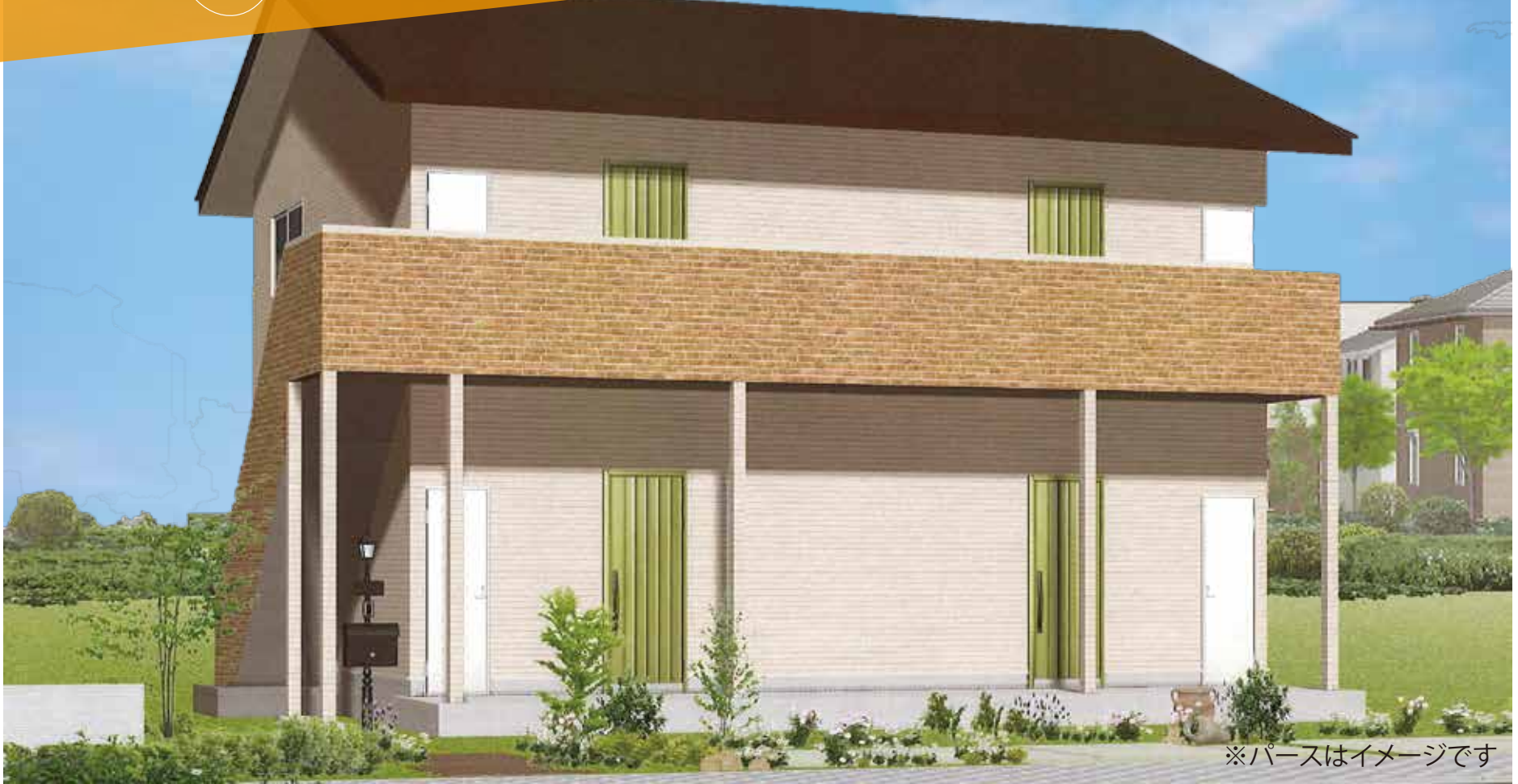
※パースはイメージです