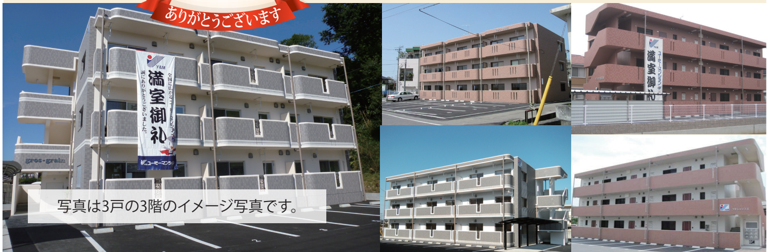
写真は3戸の3階のイメージ写真です。

松山市内で 100棟目 入居者に選ばれてきたRCマンションです おかげ様で ありがとうございます