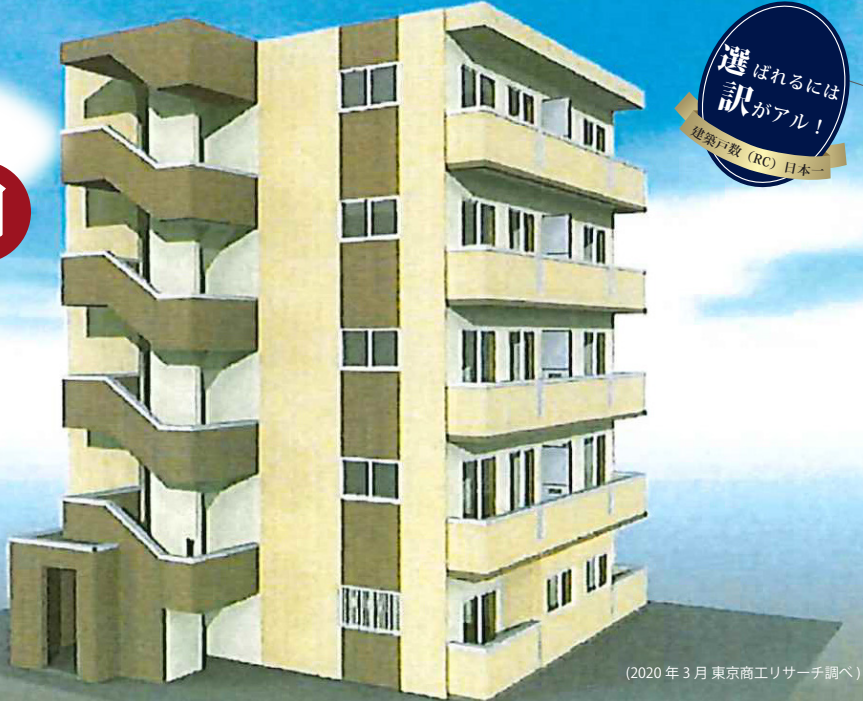
(2020年3月 東京商工リサーチ調べ)